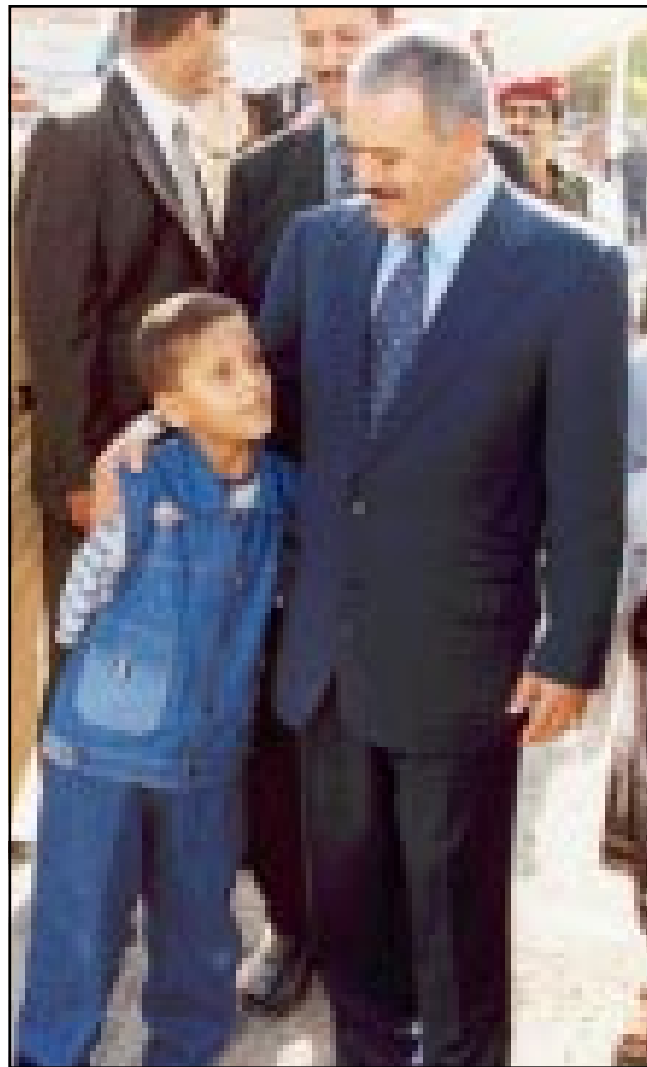
كما أن الدولة ستستهم في هذا الجانب وسيكون للقطاع الخاص دور إيجابي - وقد حرصت اللجنة التحضيرية - على دعوة كل الجهات والمنظمات المتخصصة من أجل أن تقدم الرأي وتشارك في الإعداد وتقدم ما تستطيع من الدعم.

الجميع في المجتمع من مؤسسات وهيئات مجتمع مدني وأحزاب ومنظمات الخ... لا من شأنه وضع الصيغة النهائية للإستراتيجية الوطنية التي ستكون برنامج عمل وطني للسنوات القادمة وهذه الإستراتيجية هي مشروع لكل الأطفال والشباب والفئات المحرومة وطنياً والولا وترسيخ الهوية الثقافية بالإضافة إلى تنمية وبناء الشباب فكرياً ودينياً.