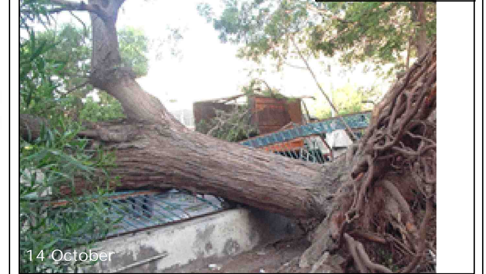
موجة الرياح التي تشهدها محافظة عدن انت لقع إحدى الأشجار العمرة في حديقة عدن بالتواهي ما أدى إلى إغلاق معمرات السيارات المتجهة إلى منطقة النجسار والمخاربة التواهي.. ولعل عدم الاعتناء بالحدائق يكون مثالاً للعنان .. المواطنين يتساقون ماذا لو ارتفعت هذه الشجرة الضخمة على فيكل سيارة مارة مليئة بالبشر أو أشخاص يعرون بجانب الحديقة!!