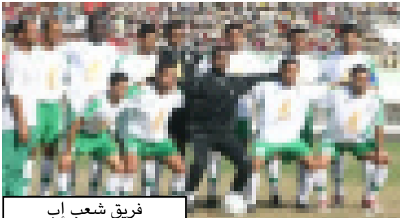
فريق شعب إب