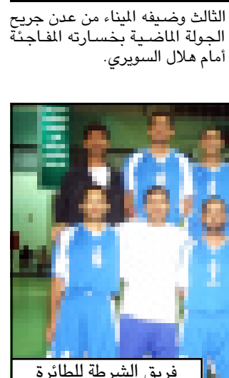
فريق الشرطة للطائرة

السابعة عصر اليوم الجمعة بإقامة لقاء واحد في سينتون يجمع هلال السوربي الذي فجر صحوه في الجولة الماضية مع ضيفه وحدة عدن أخير - الترتيب ، وتختتم منافسات الجولة السابعة لدوري الطائرة عصر السبت بلقاء وحيد في مدينة القطن بمحافظة حضرموت يجمع فريق الشرطة المتقدم للمركز