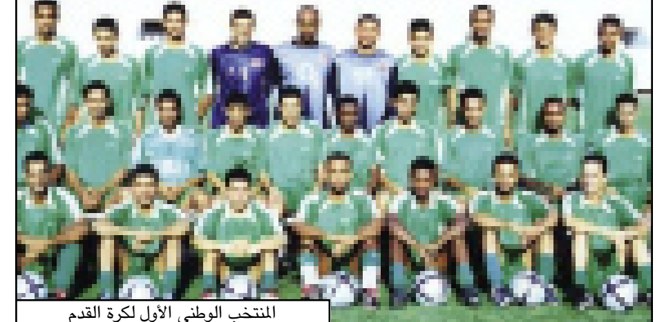
المنتخب الوطني الأول لكرة القدم