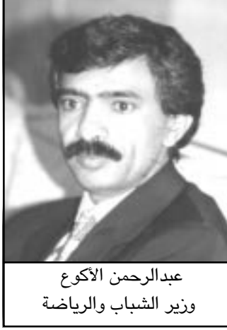
عبدالرحمن الأكوغ وزير الشباب والرياضة

المؤتمنت / التقى الاخ عبدالرحمن الأكوغ وزير الشباب والرياضة باعضاء بعثة منتخبنا الوطني لكرة القدم والذي يستعد لخوض تصفيات المجموعة الآسيوية الأولى المؤهلة لنهائيات كأس الأمم الآسيوية المقبلة في ٢٠٠٧م.