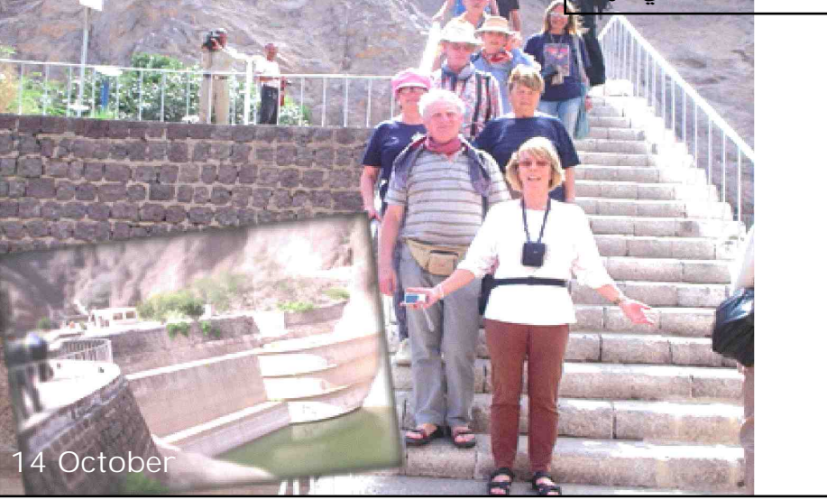
تعتبر الصحاريح من المعالم التاريخية الهامة التي تستقطب اهتمام الزائر العربي والسائح الاجنبي. نظراً لأهميتها فان هؤلاء السياح يشيدون بهذا المعلم التاريخي الهام.