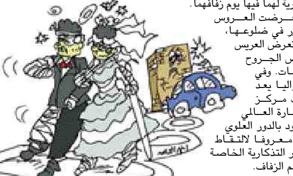
تعرضت العروس لكسور في ضلعوها، بينما تعرض العريس لبعض الجروح والكدمات. وفي أستراليا يعد مراب مركز التجارة العالمي الموجود بالدور العلوي مكاناً معروفاً للتقاط الصور التذكارية الخاصة بمراسم الزفاف.

شهد رجل وامرأة استراليان أمس حفل زفاف أسطوري عندما اصطلحت السيارة «فيراري»، التي استقلها عقب عقد قرانها بحائط في أهل ميني في مدينة مليون الأسترالية. وكان الزوجان قد استقلا السيارة «فيراري»، التي استأجراها ليتم التقاط بعض الصور التذكارية لها فيها يوم زفافها.