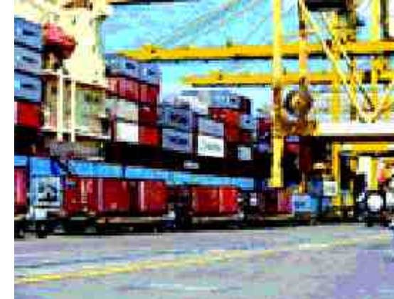
تتفيذ هذه المشاريع البالغ كلفتها حوالي (١٢) مليون دولار . مشيرا إلى ان المشاريع قسمت