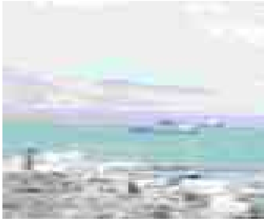
بقيمة مليون و(٤٥) ألف دولار