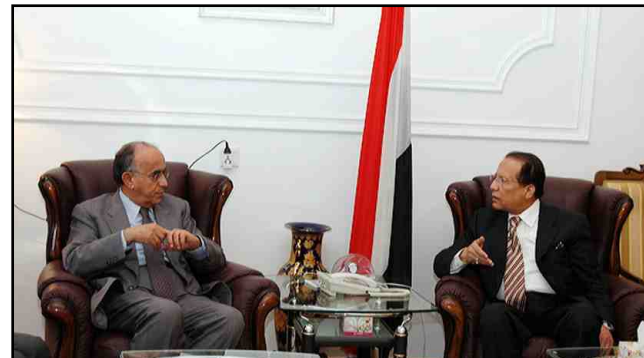
بحثا علاقات التعاون بين بلادنا والصدوق