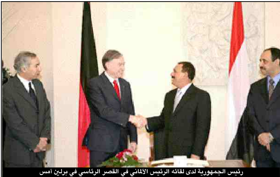
رئيس الجمهورية لدى لقائه الرئيس الألماني في القصر الرئاسي في برلين أمس

برلين / سبا : بحث فخامة الأخ الرئيس علي عبدالله صالح رئيس الجمهورية أمس فخامة هورست كولر رئيس جمهورية ألمانيا الاتحادية لدى لقائهما أمس بقصر بيلافو مقر رئاسة الجمهورية الألمانية ببرلين العلاقات المتميزة وأوجه التعاون المشترك بين بلادنا وألمانيا وعلى مختلف الأصعدة بالإضافة إلى بحث تطورات الأوضاع في المنطقة والمستجدات الإقليمية والدولية وفي مقدمتها الأوضاع الفلسطينية التي اتخذتها التشريعية الفلسطينية التي تجري اليوم -أمس- والأوضاع في العراق والصومال ومنطقة القرن الإفريقي والملف النووي الإيراني، كما تم بحث الجهود الدولية المبذولة لمكافحة الإرهاب. وقد أشاد فخامة الأخ الرئيس علي عبدالله صالح رئيس الجمهورية بعلاقات الصداقة والتعاون المتميزة القائمة بين البلدين .. موضحة أنها علاقات