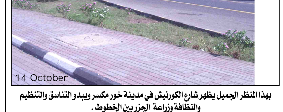
بهذا المنظر الجميل يظهر شارع الكورنيش في مدينة خور مكسر ويبدو التناسق والتنظيم والنظافة وزراعة الجزر بين الخوط .