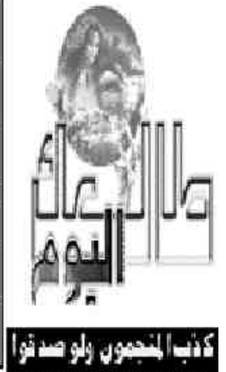
كنا المحبون ولو صدقوا