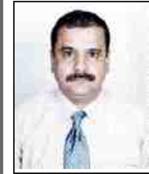
كلمات / علي حيمد