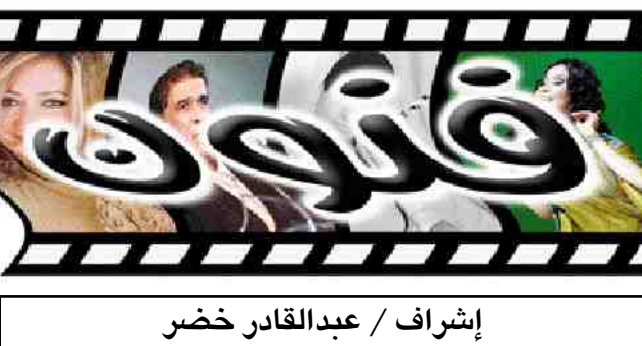
إشراف / عبدالقادر خضر

أنا أكتب أغانياتي بنفسني، وسوف أستمر طالما وأن خبرتي في هذا الجانب ناجحة.. وهذا لا يعني أنني لن أغني من كلمات غيري، بل العكس فانا على أتم الاستعداد للتعامل مع غيري شريطة أن تكون الكلمات التي تقدم لي تتناسب مع ذوقي أولاً، وتستحق أن أقدمها للجماهير المحبة لغني ثانياً.. قبل أن أكتب أية أغنية، أبداً بتكوين الفكرة والموضوع.. وعندما تتبلور الفكرة وتصيح جاهزة للتنفيذ أقوم بعرضها على بعض ممن أثق بهم لأخذ الرأي والمشورة.. وإذا اقتنعت أقوم بعملية تنفيذ الفكرة كتابة على الورق،