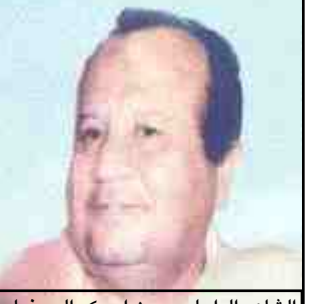
الشاعر الراحل حسين ابوبكر المحضار

ويظل : صوت الفنان الكبير / كرامة سعيد مرسال/ هو الأبرز في ساحة حضرموت الغنائية بإدائه المميز لأغانيها الجميلة التي اشتهر بها داخل الوطن وخارجه.. على