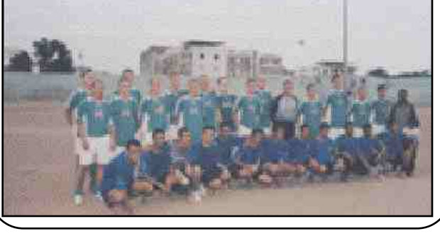
شهد ملعب الشهيد الحبيشي عصر امس الاول لقاء ودي جمع فريق خفر السواحل اليمني قطاع خليج عدن مع فريق الجارحة الألمانية التي تزور بلادنا حالياً حيث انتهى هذا اللقاء بفوز خفر السواحل بخسعة اهداف مقابل هدفين للجارحة الألمانية وقد كانت المباراة حماسية وشهدت لمحات فنية جميلة من الفريقين واداء جيداً .