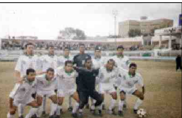
مباريات الجمعة ٢٠ يناير ٢٠٠٦م : ٥ - أهلي صنعاء Xشعب حضرموت ( ملعب الريسي بصنعاء ) ٦ - التلال Xالرشيد ( ملعب الحبيشي بعن ) ٧ - تعاون بعدان Xشباب الجيل (ملعب الكبسي باب )