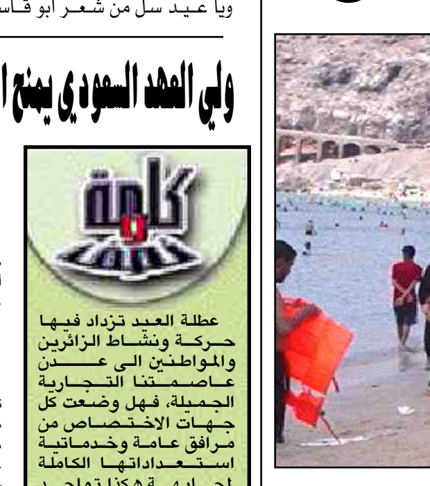
تبركا كل شيء وتجمعوا هي حضن عدن العاصمة الاقتصادية والتجارية .. والعيد موعد لقائهم السنوي .. من كل المحافظات جاءوا إلى المدينة لانهم يعشقون البحر ولأمّن والأمان