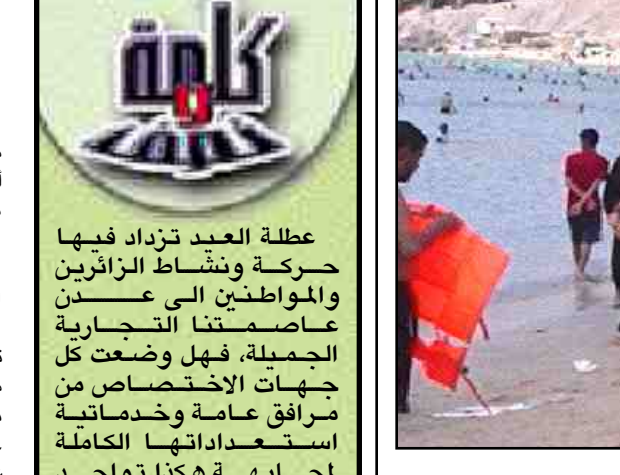
عقلة العبد تزداد فيها حركة ونشاط الزائرين والمواطنين إلى عدن عاصمتنا التجارية الجميلة، فهل وضعت كل جهات الاختصاص من مرافق عامة وخدماتية استعداداتها الكاملة لمجابهة هكذا تواجد ونشاط وحركة

صنعاء/ متابعة قالت صحيفة المنيبة السعودية ولي الأمير سلطان بن عبد العزيز ولي العهد نائب رئيس مجلس الوزراء منحت الطفل اليمني المعجرة فتحي أحمد الاضرعي - لم يكمل السادسة من عمره - سيارة فارهة وخمسة آلاف ريال كراتب شهري تقديراً لوجبه الفطرية وفصاحته في الشعر.