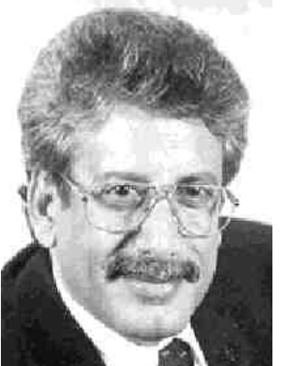
١٤ أكتوبر / عيديروس عبدالرحمن

حظي حضور نجم الكرة اليمنية وقائد النسور الأخضر في مونديال فنلندا الكابتن الشباب عبيده الادرسي ، حظي باستقبال تلامي مهب في نزله لمدنية عدن للاتحاق بالضيافين الحمر .. وقد ساد الشارع الرياضي العدني ارتياح مكثف وسعادة بالغة جراء مصادفة الادارة الحمراء في تعظيم الفرق بأفضل العناصر الكروية لعباً وأخلاقاً ..