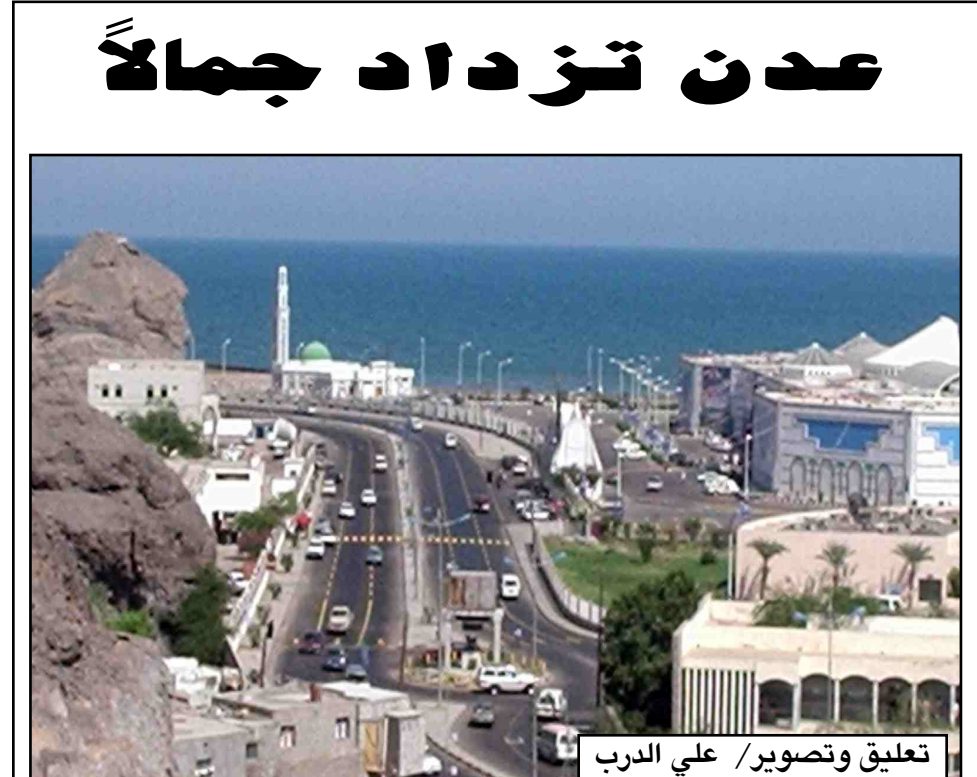
بامتداد هذا التناسق في المكان الذي تضيء عليه الإنارة والتشجير منظرًا جميلاً يعكس الأصالة في البنيان الجديد على جانبي الطريق من كريتير إلى خورمكسر لم يكن أن يمر فيها مبدع دون أن يرسم لها صورة للذكرى.