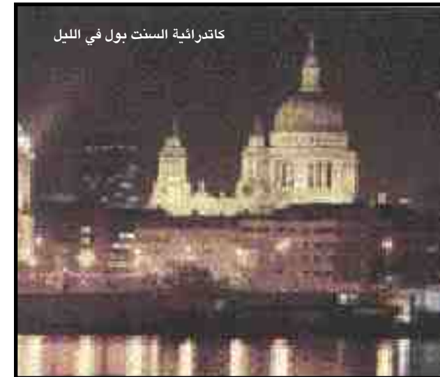
كاتدرائية السنت بول في الليل