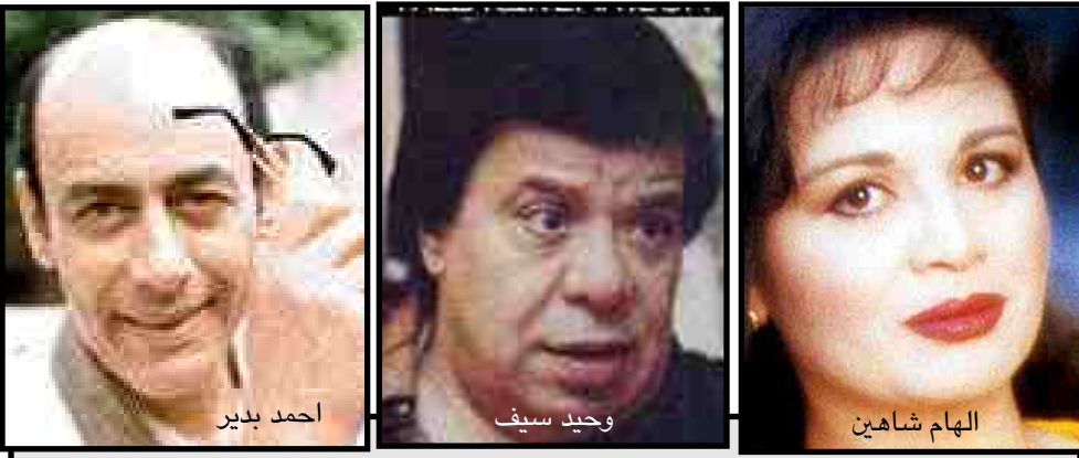
المصريون غنوا للقطن والفول والقمح فدادين خمسة