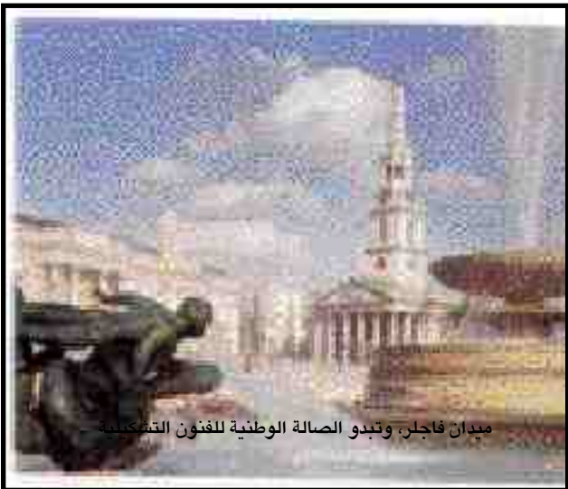
ميدان فاجلر، وتبدو الصالة الوطنية للفنون التشكيلية