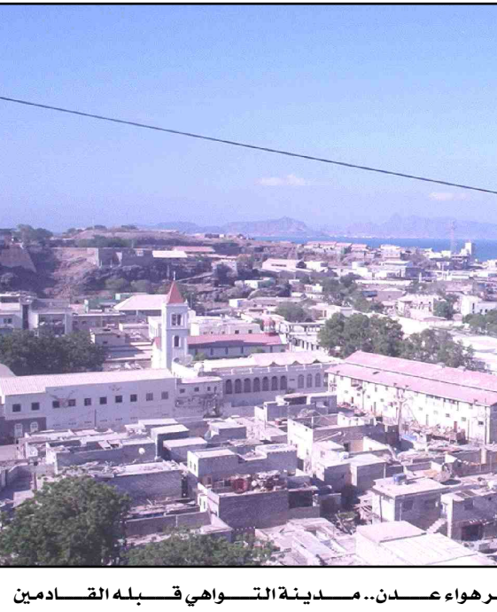
عدن هي البحر... والبحر هو عدن.. مدينة التواهي قبله القادمين الى عدن عبر البحر.. وقلوب مدينة تتوحد لكل ابناء الوطن