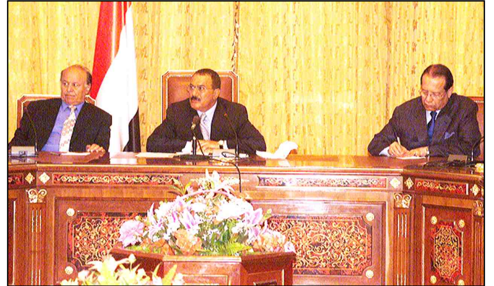
عند / سبأ: عقدت اللجنة العامة الجديدة للمؤتمر الشعبي العام أمس بمدينة عدن أول اجتماع لها برئاسة فخامة الأخ الرئيس عبد الله صالح رئيس الجمهورية رئيس المؤتمر الشعبي العام. وفي بداية الاجتماع هنأ الأخ الرئيس الجميع بالنجاح الكبير الذي حققته الدورة الأولى للمؤتمر العام السابع للمؤتمر الشعبي العام التي انعقدت بمدينة عدن، سواء على الصعيد الترتيبي أو التحضيري الجيد لها أو على الصعيد الدلالات والنقاشات الديمقراطية والشفافية والتي دارت

الرياض / سبأ: أكد الأمير سعود الفيصل وزير الخارجية السعودي أن اليمن بلد مهم لنا جميعاً وهو الآن يصدد مواصلة انظمته وقوانينه الاقتصادية والاجتماعية مع أنظمة دول المجلس وقد يكون من المفيد لليمن أن يتخذ وقته الكافي لتحقيق هذه الغاية لا سيما أنه بحاجة إلى طاقاته وقدراته في الوقت الراهن لتحقيق التنمية والتطوير الشامل وعندما تكتمل هذه الخطوات فإن اليمن سيكون مهياً لذلك بصورة أفضل وهناك مشاركة حقيقية فاعلة لليمن في بعض المجالات التي تتسع بصورة تلقائية مع مرور الأيام. وأكد الأمير سعود الفيصل في تصريح نشرته صحيفة (عكاظ) أن هذا الاجتماع قد يتم في غضون الأشهر الثلاثة القادمة حيث يعقب