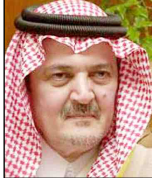
السبت.. وفد تجاري سعودي يصل صنعاء