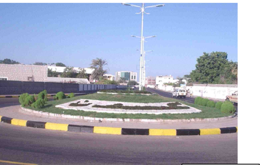
هذه الطريق الممتدة من وإلى المطار بجلتها الزاهية ورونقها الجميل تستقبل وتودع الزوار من وإلى مدينة عدن