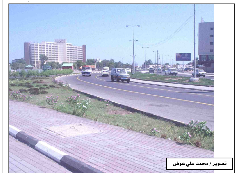
توسعت طرق مدينة عدن وازدادت جمالا حيث أصبحت تتسع لانطلاق السيارات والمارة بحرية تأمل ان يستمر توسيع الطرق الداخلية في كافة محافظات عدن حتى يتم ربط جميع مديريات المحافظة .