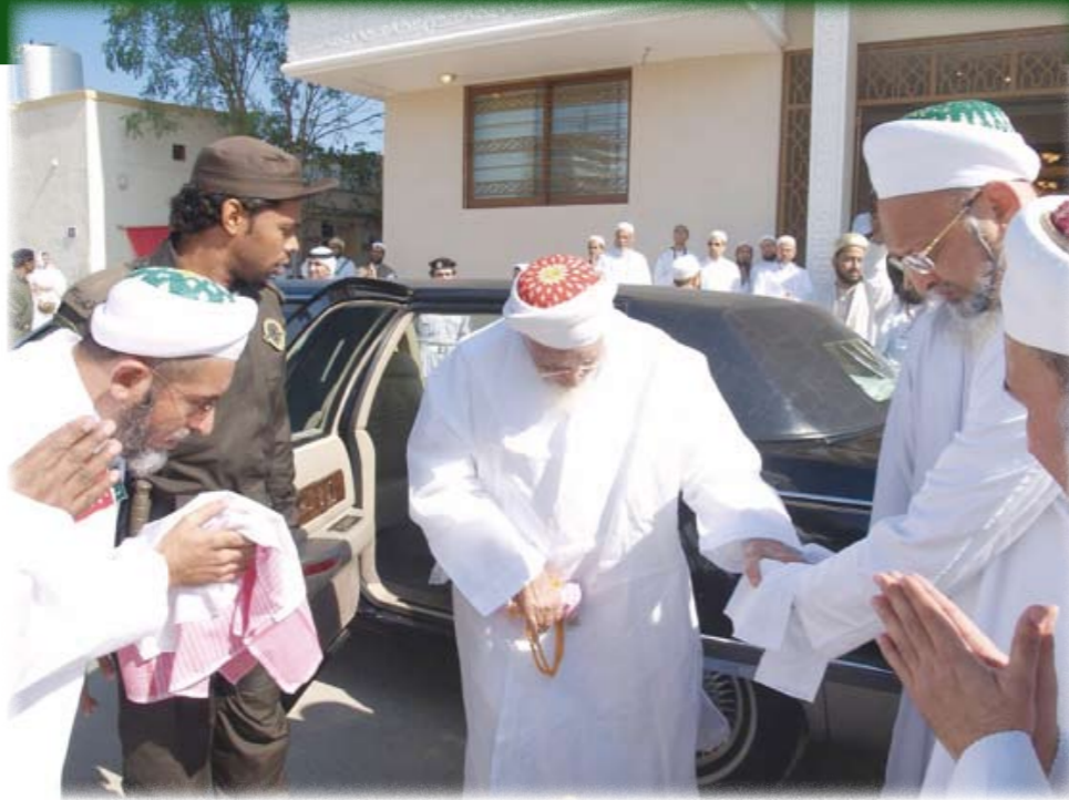
■ البهرة الاسماعيلية