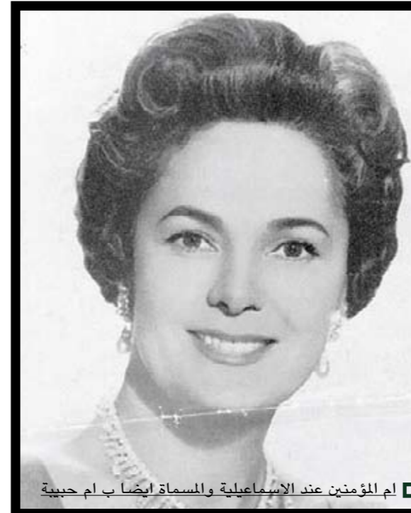
■ ام المؤمنین عند الاسماعيلية والمسماة ايضا ب ام حبيبة