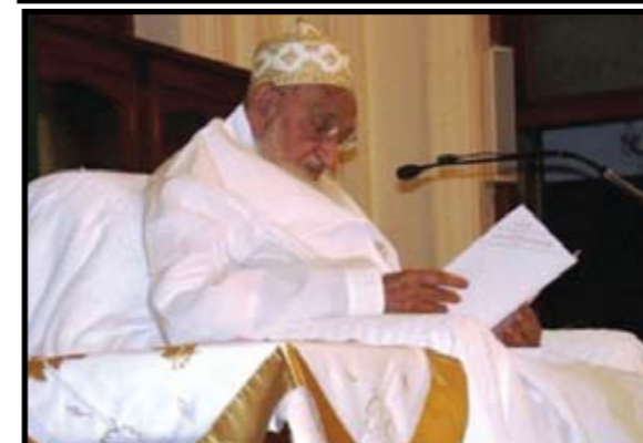
■ محمد برهان الدين سلطان الاسماعيلية البهرة